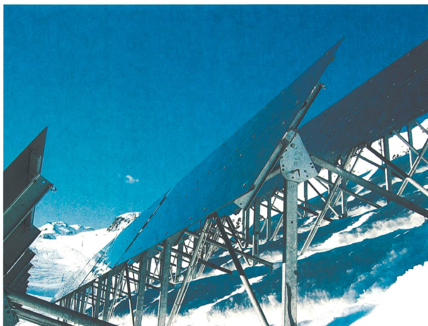
Die Ökostrom-Nachfrage stieg kurzfristig an (im Bild: Solaranlage im bündnerischen Caischavedra).

Der vorliegende Beitrag ist eine gekürzte Fassung des Axpo-Flash-Artikels vom November 2011, S. 8.