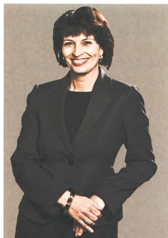
Keynote Referat von Bundesrätin Doris Leuthard