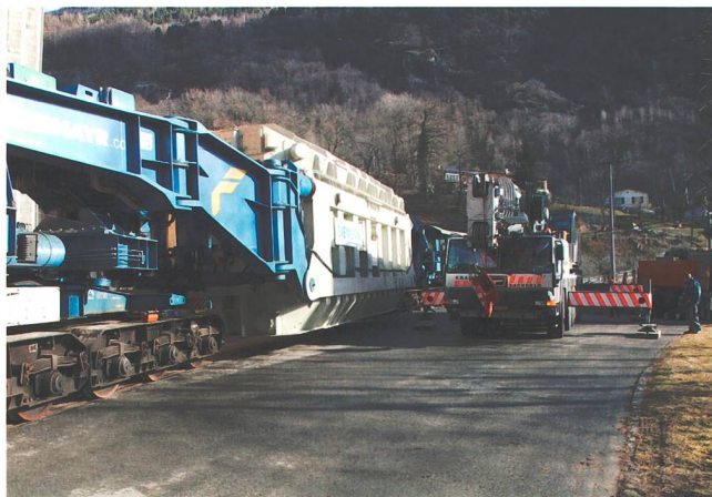
Bild 2 Wegen des hohen Gewichts konnten die Transporte nicht auf der Strasse erfolgen. Der Bahntransport war der grösste und schwerste, der jemals durch den Gotthardtunnel gerollt ist.

bezüglich Masse und Gewicht einhalten zu können. Die alten 600-MVA-Phasenschieber-Transformatoren wurden mit zwei Kesseln pro Phase gebaut – mit Transformator- und Regel-Einheit in separaten Kesseln à je rund 90 t. Es ist anzunehmen, dass diese Grösse der maximal zulässigen Transportgrösse entsprach. Die Siemens-Ingenieure entschieden sich hingegen für eine Ein-Kessel-Variante, bei welcher sich Transformator- und Regeleinheit für eine Phase im gleichen Kessel befinden. Die zwei Aktivteile sind hintereinander angeordnet, und jeder verfügt über einen Laststufenschalter für die Wahl des Regelbereiches.