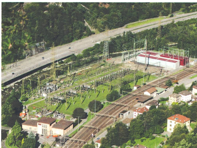
Bild 1 Die Schaltanlage Lavorgo spielt für die Zukunft des Schweizer Hochspannungsnetzes eine wichtige Rolle: Zunächst auf der Nord-Süd-Achse und später auch in der 380-kV-Ost-West-Achse von Frankreich bis nach Italien.

Die Transformatoren wurden im Innern extrem optimiert, um die Vorgaben