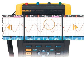
Das für industrielle Umgebungen entwickelte, tragbare Oszilloskop ScopeMeter 190 Serie II.