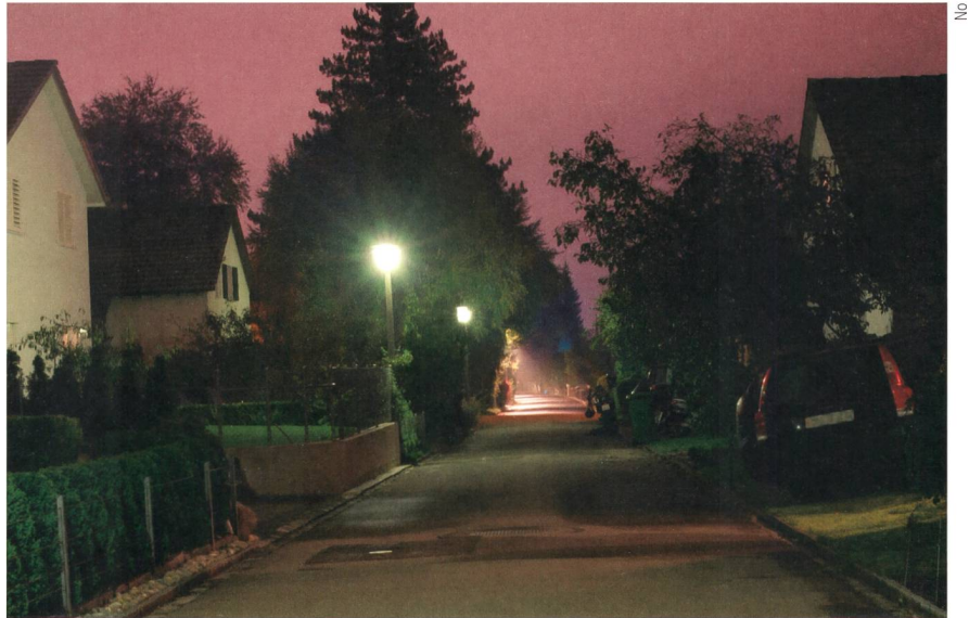
Bild 3 «Pilzleuchten» (vorne) und LEDs beleuchten die Röslistrasse. Die Huber-Pilzleuchten sind mit HQL-Quecksilber-Leuchtmitteln mit einer Leistung ohne Vorschaltgerät von 50 W und die LEDs mit Mini-Quadrolux-2-Leuchtmitteln mit einer Leistung ohne Ansteuerung von 31 W ausgestattet.

Der Einsatz von Bewegungsmeldern erhöht die Gangreserve auf über 10 Tage. Zudem kann man sowohl Beleuchtungs-