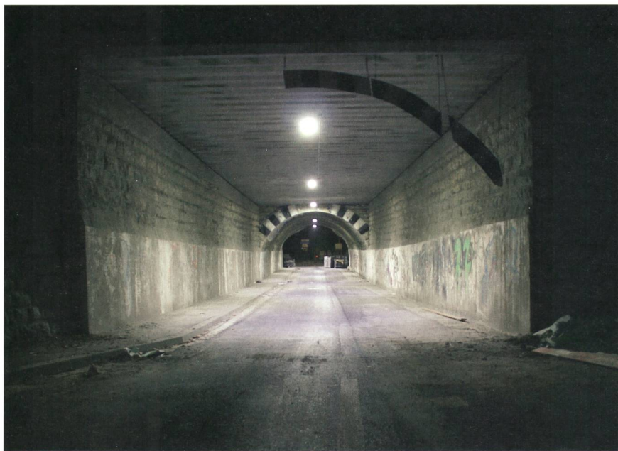
Bild 5 Eine Unterführung wurde durch EWB mit 5 LED-Leuchten à 70 W Systemleistung ausgerüstet. Die Ausleuchtung ist hervorragend.

men treffen und Installateure bezüglich der Auswirkungen informieren.