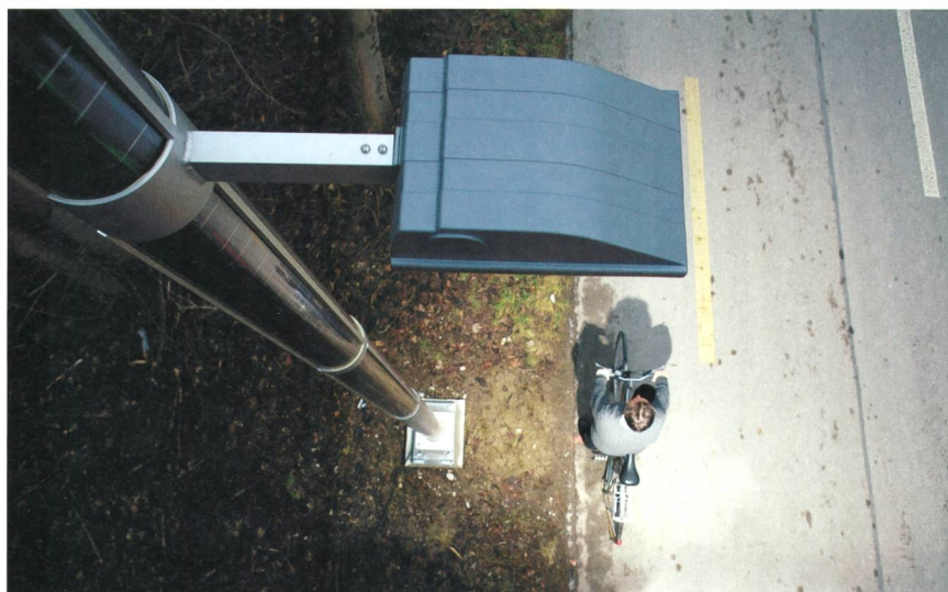
Bild 6 Ein Radweg in Aarberg: Licht wird am Tag gesammelt und in der Nacht abgegeben – eine autarke LED-Lösung mit in der Säule integrierten Fotovoltaikzellen.

Electrosuisse, 8320 Fehraltorf radomir.novotny@electrosuisse.ch