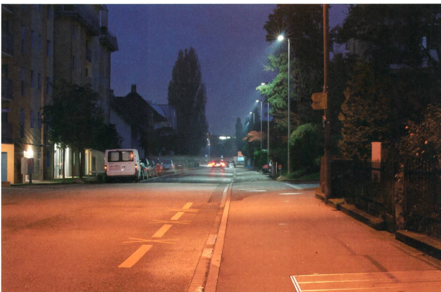
Bild 4 Vorne Natriumdampf und hinten LED: Der Farbkontrast ist auf der Schwarzackerstrasse in Wallisellen nicht zu übersehen.

Bei der Installation der LED-Leuchten sollte man deshalb ESD-Schutzmassnah-