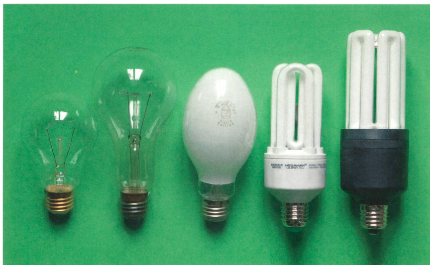
Bild 1 Von links: Glühlampe 150 W, 200 W, Quecksilberdampflampe 80 W, kompakte Leuchtstofflampe 30 W, 60 W (siehe Tabelle 2 ).

Die Lampen mit integriertem Vorschaltgerät können in bestehenden Leuchten verwendet werden, man muss lediglich die Vorschaltdrossel oder das Vorschaltgerät überbrücken. Es gibt allerdings eine Einschränkung: Wegen der grossen Lichtfläche und dem weniger gebündelten Lichtfluss der Leuchtstofflampe können vorhandene Leuchten mit dem gleichen Reflektor nur für eine maximale Aufstellhöhe