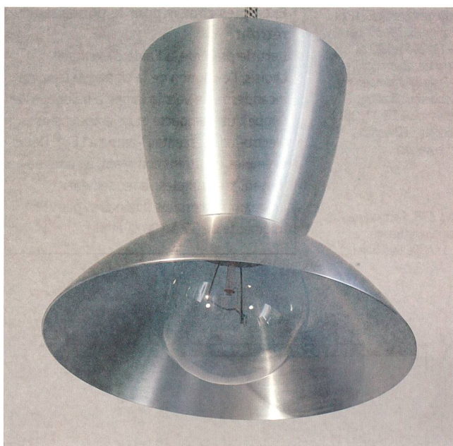
Bild 2 Alt und neu vereint: Eine Pendelleuchte mit Gegengewicht aus dem Jahre 1920 bestückt mit dem Reflektorsatz «hangover_no. 1». Der untere Reflektor verbessert die Lichtstärke um einen Faktor 4.