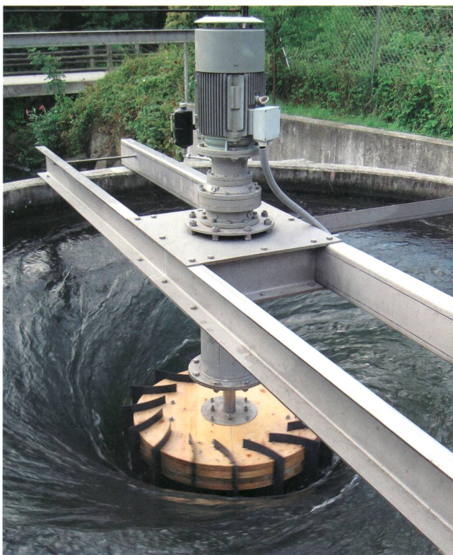
Bild 1 Das kompakte 10-kW-GWVPP mit Asynchrongenerator, Planetengetriebe und Zotlöterer-Turbine in Obergrafendorf, Österreich, produziert jährlich 60 000 kWh.

Im Rotationsbecken entsteht über der mittigen Abflussöffnung ein Gravitationswasserwirbel, der in seinem Zentrum die Zotlöterer-Turbine – im Folgenden auch einfach Turbine genannt – samt elektrischem Generator antreibt. Unterhalb des Rotationsbeckens fließt das Wasser wieder zurück in das Fließgewässer. Fische und Kleinlebewesen können das GWVPP unbeschadet durch die Turbine oder ohne besondere Kraftanstrengung über eine flache Rampe im Aussenbereich des Rotationsbeckens sowohl stromauf- als auch stromabwärts passieren. Im betroffenen Gewässerabschnitt entsteht keine Restwasserstrecke und Hochwasser kann problemlos über das niedrige Wehr und durch den geöffneten Grundablass abgeführt werden.