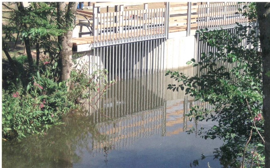
Bild 5 Ein in die Uferböschung integriertes GWVPP im österreichischen Wimitz.

Da GWVPPs nahe bei den Verbrauchern liegen, können etwa 12% an Übertragungsverlusten gegenüber Atomkraftwerken eingespart werden. Somit ersetzen 30 000 dezentral gelegene 20-kW-GWVPPs mit Gesamterrichtungskosten von 4950 Mio. Euro ein 600-MW-AKW. Trotz der grossen Anzahl an GWVPPs können diese wegen ihrer geringen Fallhöhe unscheinbar ( Bild 5 ) in die bestehende Fliessgewässerlandschaft integriert werden. In Europa gibt es rund 5 Millionen potenzielle Standorte für GWVPPs.