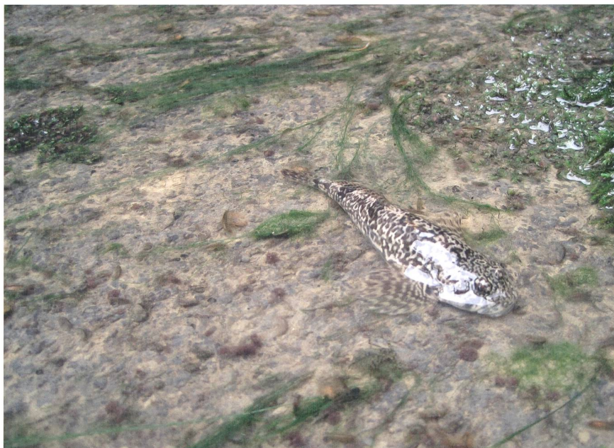
Bild 4 Kleinlebewesen und Fische im Rotationsbecken eines GWVPP.

stetig beschleunigend, in Richtung Wirbelzentrum auf die Turbine zu. Ähnlich wie bei einem Wasserfall zieht sich dabei ein Wasserfaden in Fallrichtung bzw. hier in Strömungsrichtung auseinander. Dazwischen wird Luft in die spiralförmige Wasserströmung eingesogen und durch den Gravitationswasserwirbel stetig an die Innenwand- und Bodenfläche des Rotationsbeckens geführt. Dort siedeln sich in kurzer Zeit je nach Nährstoffgehalt und Temperatur des durchströmenden Wassers gewässerspezifische Wasserpflanzen (u.a. Quellmoose) an. Diese bilden einen gut durchlüfteten Lebensraum für Kleinlebewesen (u.a. Bachflohkrebse, Köcherfliegenlarven) und Fische ( Bild 4 ).