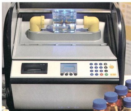
Zahlreiche Diagnosegeräte, wie hier für die Transformatorölanalyse, unterstreichen die Tatsache, dass die Versorgungs- und Ausfallsicherheit keine Selbstverständlichkeit ist.

Am Mittwoch übernahm der Verband Schweizerischer Elektrizitätsunternehmen VSE das Patronat des Forums und