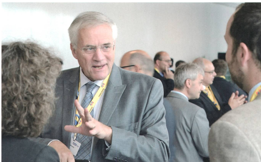
An den Powertagen hatten nicht nur die Aussteller offene Ohren für Fragen, sondern auch die Energie-Prominenz – wie beispielsweise der BFE-Direktor Walter Steinmann.

Vom 12. bis 14. Juni traf sich die Schweizer Energiebranche an den Powertagen in Zürich-Oerlikon. Über 120 Aussteller luden zum Gespräch und zum Kennenlernen neuer Produkte ein. Jeweils am Morgen traf man sich im Forum, in dem es primär um Themen im Zusammenhang mit der Energiezukunft ging.