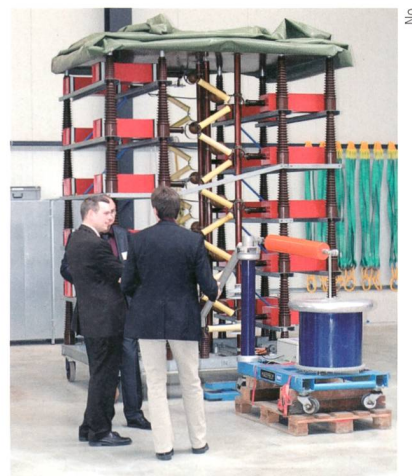
Mehrstufiger Marx-Generator der FKH für Stossspannungsprüfungen.

men die Isolationsdiagnostik und die Isolierölanalyse hinzu. Heute präsentiert sich die FKH als unabhängige Institution, die zahlreiche Dienstleistungen im Hochspannungsbereich anbietet und eine Brückenfunktion zwischen den schweizerischen Hochschulen und den Unternehmungen der Elektroenergiertechnik ausübt. No