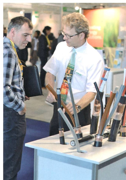
Produkte zum Anfassen. Auch Skeptiker konnten sich von den Qualitäten der Exponate überzeugen.

Auch die Elektromobilität fehlte nicht: Vor dem Messeingang wurden diverse Fahrzeuge und im Eingangsbereich sowie bei einzelnen Ausstellern AC- und DC-Ladesäulen gezeigt. Radomir Novotny