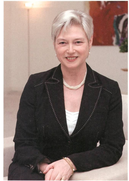
Maria van der Hoeven, Direktorin der internationalen Energieagentur, empfiehlt, dass sich die Schweiz stärker vernetzt.

Da der IEA die Einbettung in Europa ein zentrales Anliegen ist, begrüsst sie die Verhandlungen über ein Stromabkommen mit der EU. Sie wünscht sich zudem Vereinbarungen in Bereichen wie Erdgas oder Energieinfrastruktur. Auch solle die