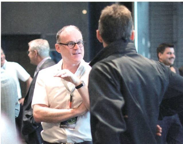
Rund 400 Teilnehmende profitieren nicht nur von interessanten Vorträgen, sondern auch vom persönlichen Gespräch.