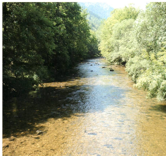
Entre Les Moyats et Champ-du-Moulin-Dessous le lit de l'Areuse s'élargit provisoirement.

A noter encore que Viteos souhaite développer le chauffage à distance : un investissement supplémentaire de 50 millions est prévu sur les dix prochaines années. Gn