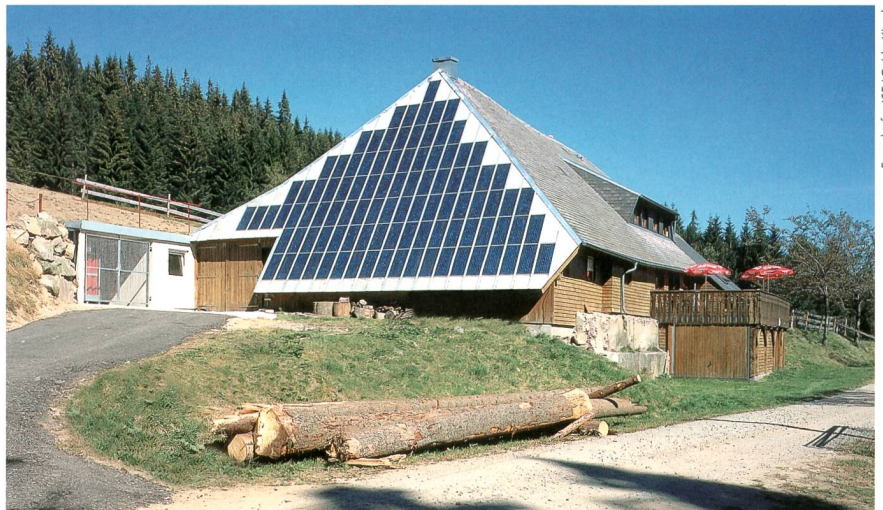
Solargenerator auf der Rappenecker Hütte im Schwarzwald.

Heute wird der Jahresstromverbrauch von 4000 kWh der Rappenecker Hütte, die in den Wintermonaten geschlossen ist, zu rund 65% von der Fotovoltaik gedeckt. Der Windkraftanteil beträgt rund 10% und der Brennstoffzellenanteil etwa 25%. No