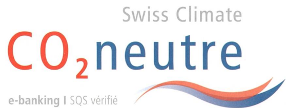
Figure 3 Le label CO 2 neutre atteste que le service ou le produit est sans émissions de CO 2 et que les émissions résiduelles sont compensées 1) .

Ces dernières ont été regroupées en deux paquets d'évolution fonctionnelle au premier semestre et un paquet de maintenance au second. En pratiquant de la sorte, la BCF ménage la stabilité de sa production tout en assurant sa qualité et sa sécurité. Collatéralement, elle réduit de trois quarts les coûts d'installation et des tests d'acceptation, ainsi que la consommation d'énergie et de CO 2 qui en découle.