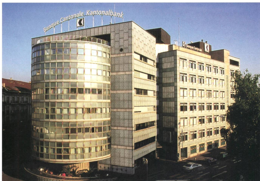
Figure 1 La Banque cantonale de Fribourg : le premier service financier de Suisse ISO-certié CO 2 neutre.

Pour la gestion de ses émissions de CO 2 , la BCF a choisi de suivre le standard ISO qui constitue un indicateur international et une marque de qualité et a, pour ce faire, demandé à la société Swiss Climate d'établir en sous-traitance son bilan CO 2 . La BCF est ainsi devenue en 2009 la première banque cantonale à établir son bilan CO 2 selon la norme ISO 14064, puis en 2011 la première banque en ligne certifiée CO 2 neutre selon ISO 14044 ( figure 1 ). Depuis 2010, la BCF dispose également du label d'argent de Swiss Climate ( figure 2 ) qui atteste que son bilan est établi selon la norme ISO et qu'elle investit 50 CHF par tonne de CO 2 émise dans des mesures conduisant à réduire ses émissions.