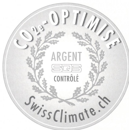
Figure 2 Le label CO 2 optimisé atteste de l'établissement du bilan CO 2 ainsi que de l'investissement de 50 CHF par tonne de CO 2 émis dans des mesures de protection du climat 1) .

Les serveurs de la BCF ont été virtualisés à 80% en 2011. Cette technique permet de faire fonctionner plusieurs applications sur le même serveur physique.