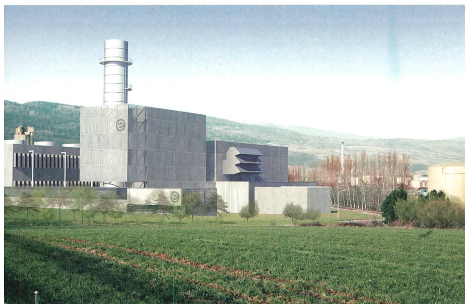
Le site de Cornaux dispose de nombreux atouts pour accueillir la nouvelle centrale à gaz.

Ducrest: Sans trop m'avancer, je dirais qu'un important travail de communication et de lobbying reste à faire à Berne auprès des Offices concernés. Nous devons les convaincre qu'une participation helvétique au système européen d'échange des quotas de CO 2 reste la meilleure solution si l'on veut un jour construire des centrales à gaz en Suisse.