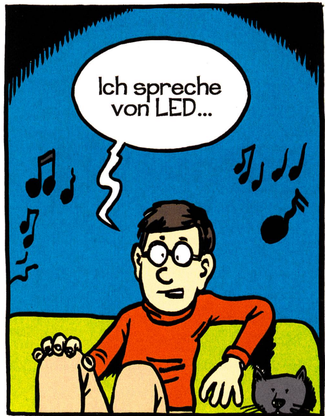
Je parle des LED ...