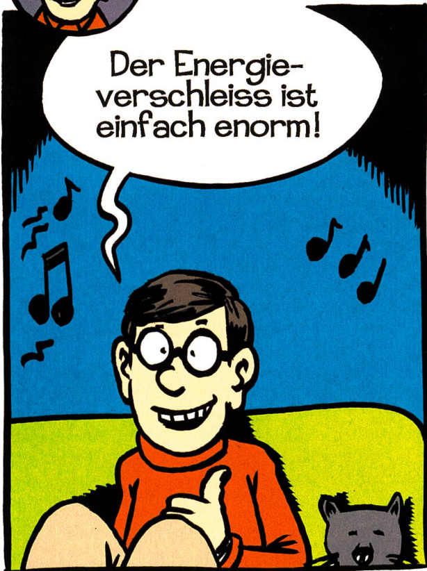
La dissipation d'énergie est vraiment énorme !