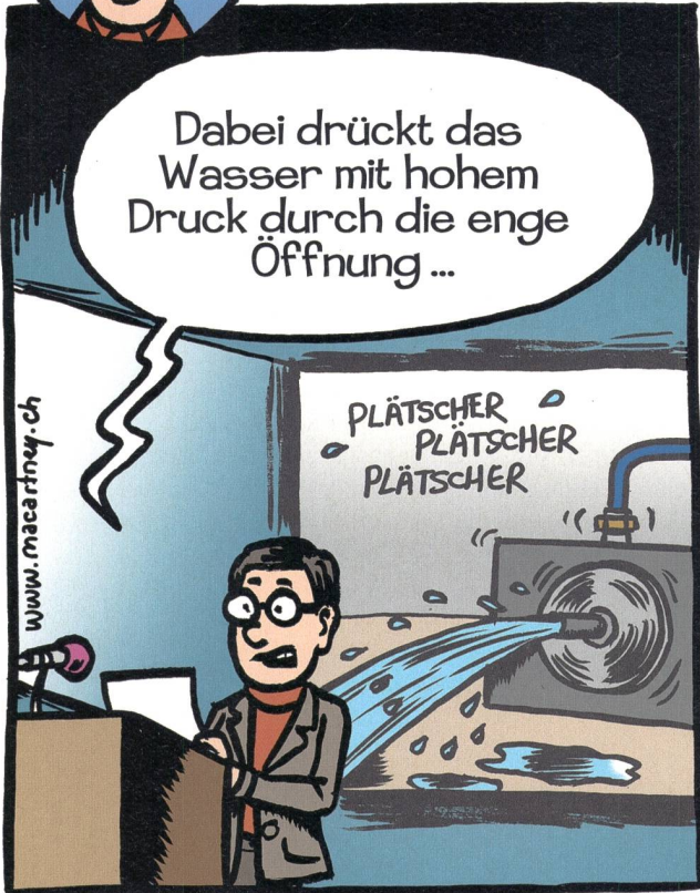
L'eau est expulsée à haute pression à travers l'étroite ouverture ...