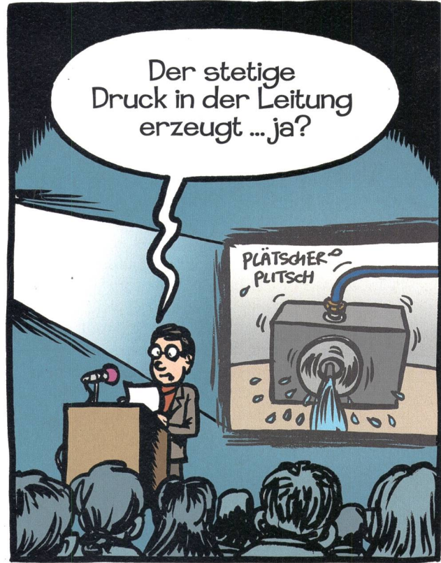
La pression continue dans la conduite engendre ... Oui?