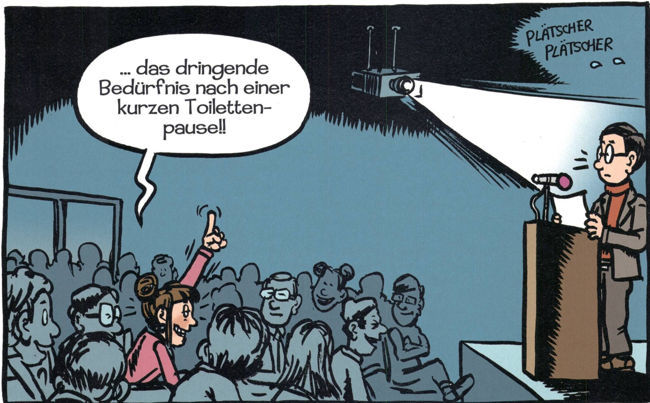
... le besoin urgent d'une courte pause pour aller aux toilettes !!