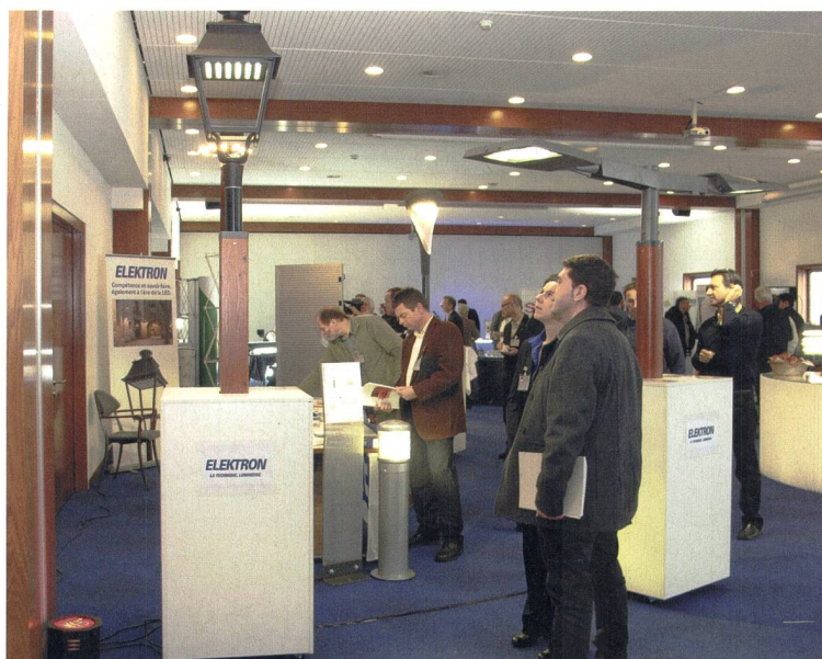
... ou un éclairage urbain s'intégrant avec douceur dans les lieux témoins de notre passé, les LED s'adaptent à chaque situation.