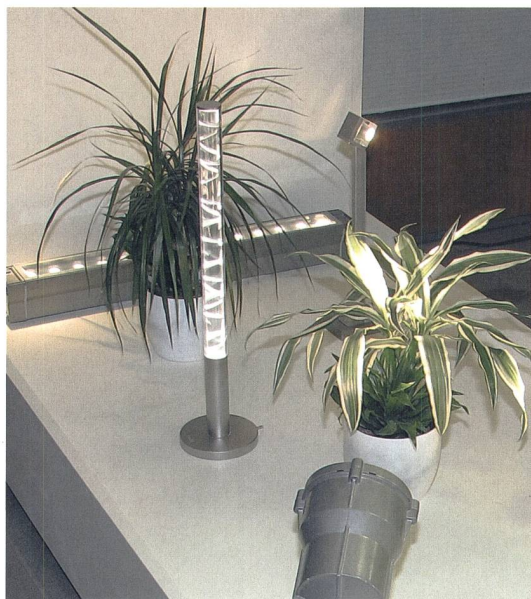
Que ce soit pour un éclairage d'ambiance avec un design résolument moderne ...