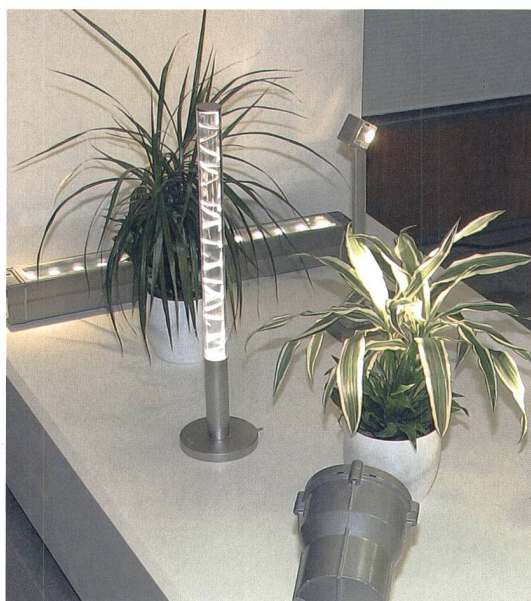
Que ce soit pour un éclairage d'ambiance avec un design résolument moderne ...