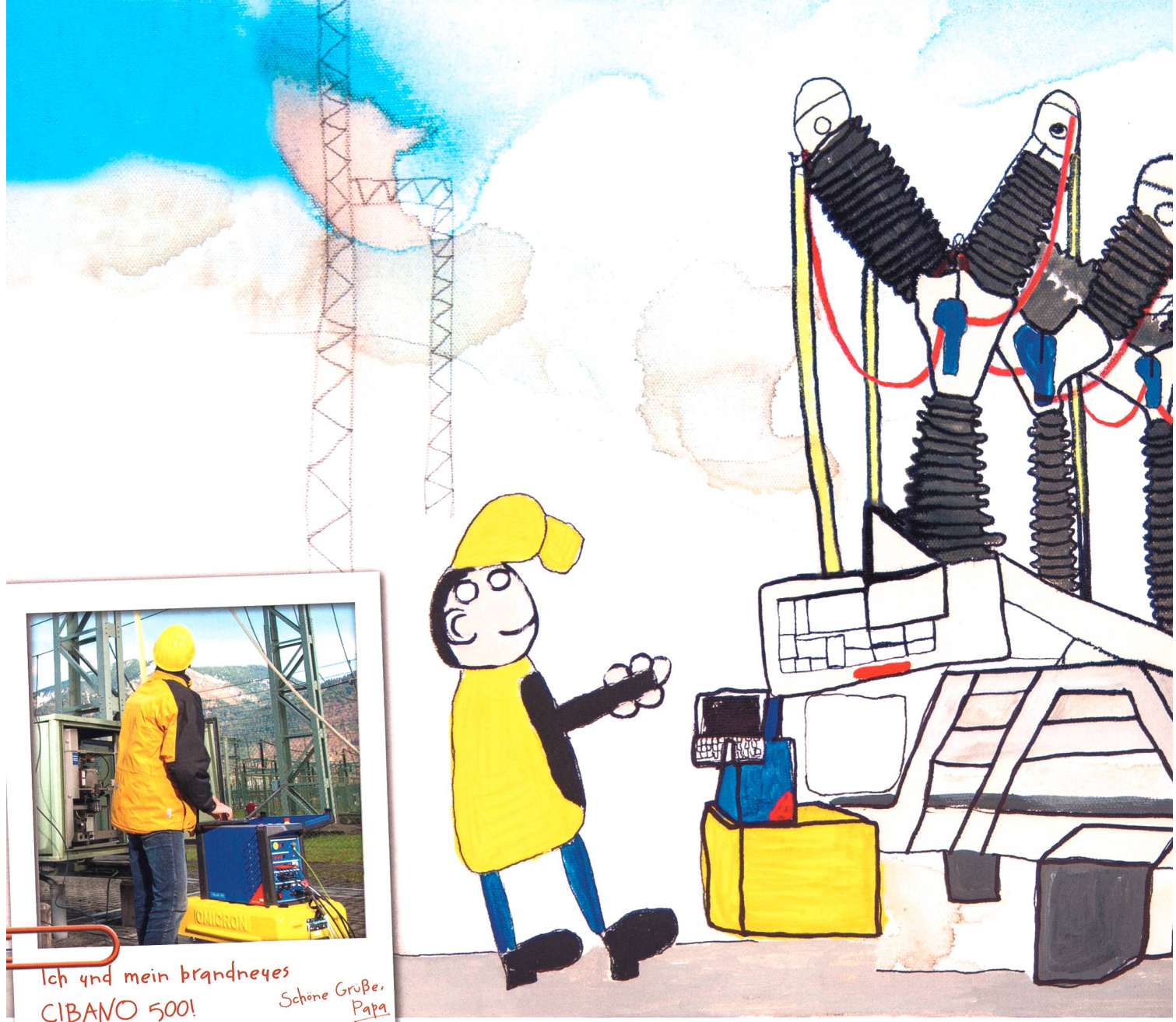
Ich und mein brandneues CIBANO 500! Schöne Grüße, Papa