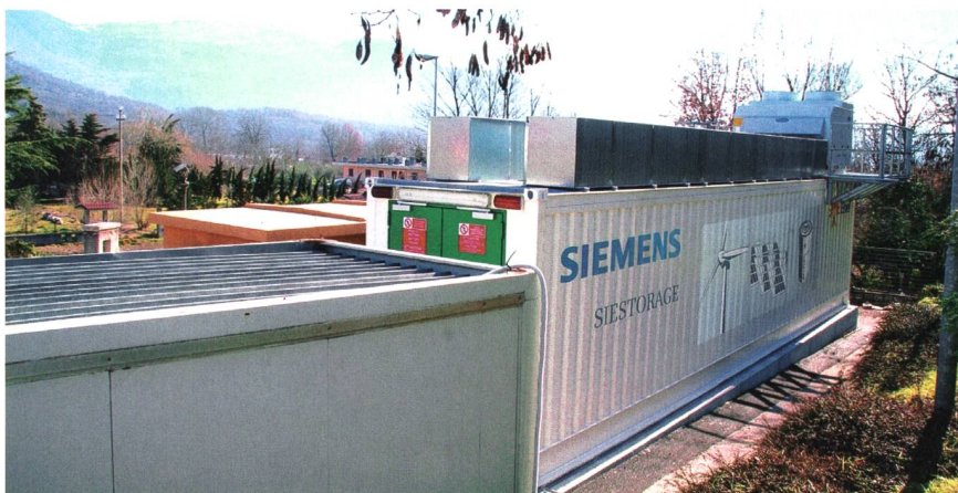
Bild 4 Batteriesystem des Isernia-Projekts in Italien.

Es hat sich gezeigt, dass sich Lithium-Ionen-Batteriespeicher vor allem im Niederspannungsbereich als Netzentlastung bzw. zur Aufnahme von überschüssiger Solar- oder Windenergie als lukrativ erweisen könnten. Für die Frequenzregulierung bzw. für die Speicherung grösserer Energiemengen ist die Anbindung ans Mittelspannungsnetz vorteilhafter, da die Verluste kleiner sind. Grundsätzlich ist die in Dietikon installierte Lösung für in-