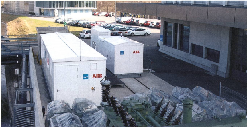
Bild 2 Batteriespeicher bei den EKZ in Dietikon. Links ist der Speichercontainer, rechts befindet sich die Leistungselektronik.

und andererseits die Tatsache, dass sie nur in einem beschränkten Bereich geladent und entladen werden sollten, will man ihre Lebensdauer nicht unnötig verkürzen. Bei zu tiefer Entladung können nämlich mechanische Überbeanspruchungen der Batterie durch Materialablagerungen an den Elektroden auftreten. Beim Überladen entsteht hingegen durch Elektrolyse des Wassers unerwünschtes Knallgas. Verwendet man einen lebensdauerschonenden 20%-Kapazitätsbereich, muss das Fünffache der gewünschten Kapazität installiert werden.