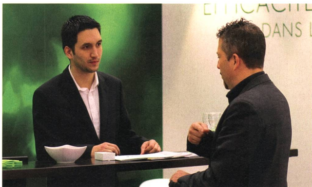
Les visiteurs d'Energissima ont pu profiter de la présence d'une quarantaine d'exposants, actifs notamment dans les domaines des énergies renouvelables et de l'optimisation des ressources.

La prochaine édition du SELD aura lieu au printemps 2014 et celle du salon Energissima en 2015. Cynthia Hengsberger