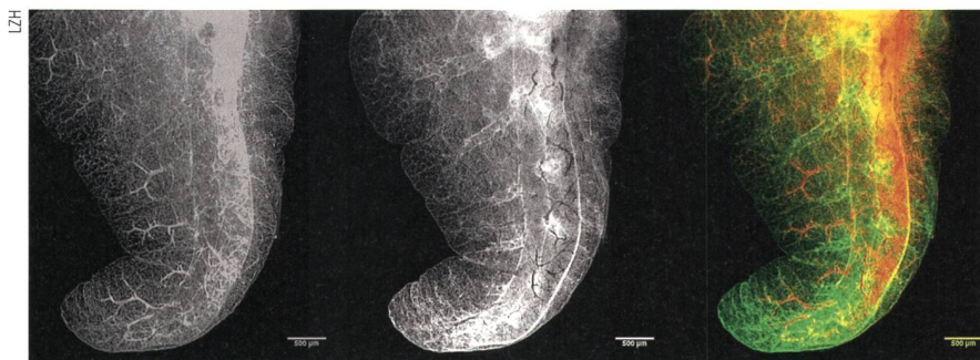
Rohdaten einer Mäuselunge. Links: Transmissionsbild (Fotodiode). Mitte: Autofluoreszenzbild (Fotomultiplerröhre). Rechts: Überlagerung der Signale (rot: PD, grün: PMT; Skalierung 500 µm).

Ebenfalls im Fokus der Forscher stand eine Methode, die Veränderungen an Fotos im JPEG-Format findet und auf der Zahl der Dateikomprimierungen basiert. Wird ein Foto in diesem Dateiformat abgespeichert, hinterlässt der Vorgang digitale Spuren. Wird jedoch ein Bild retuschiert, verschwinden diese Spuren – allerdings ausschliesslich an den betreffenden Stellen. Bei einem manipulierten Foto existieren also Ausschnitte, die nur einmal, und zwar von der Fotosoftware komprimiert wurden, sowie originale Bereiche, die sowohl von der Kamera als auch von der Software komprimiert wurden. Mit diesem Wissen trainierten die Forscher anhand von Beispielen ein Programm, das automatisch Bildausschnitte erkennt, in denen die Zahl der Komprimierungen abweicht. No