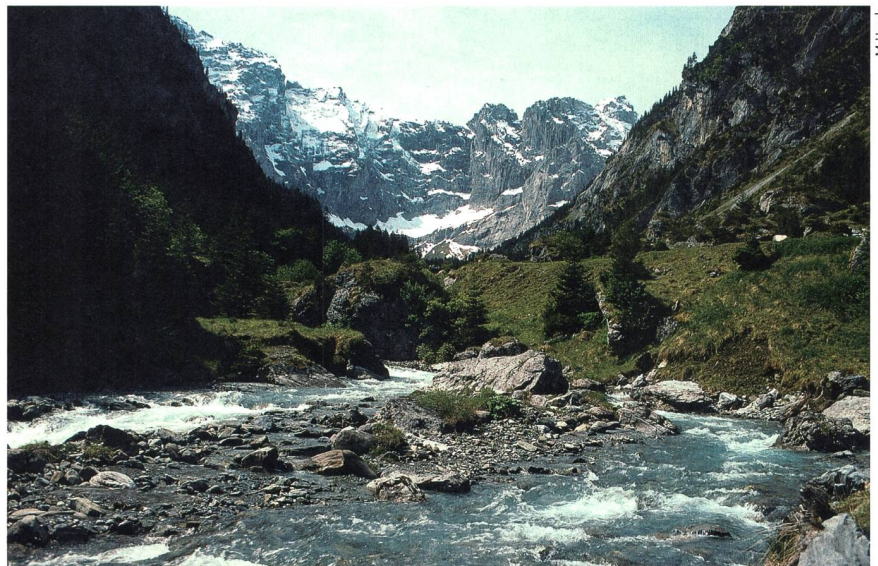
Das Hintere Schächental gehört gemäss Snee-Vertrag künftig zu den geschützten Landschaften.

Mit dem Snee-Vertrag verfügen der Kanton und die Korporation Uri über ein in dieser Art bisher einzigartiges Konzept, das die Zielkonflikte zwischen Landschaftsschutz und Gewinnung von erneuerbaren Energien regelt. Im Kanton Uri betrifft dies vor allem die Wasserkraft. Das Konzept beschränkt sich dabei auf Aspekte rund um den Landschaftsschutz und berücksichtigt nicht die Eigentumsrechte an den betreffenden Gewässern. Se