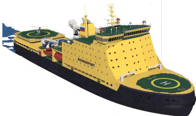
Bild 1 Der Motor ist in der Gondel eingebaut. Somit ist mehr Platz verfügbar.

Das Antriebssystem des Schiffes besteht aus zwei Azipod-Einheiten der neuesten Generation (2x7,5 MW) und einem Wellenstrang auf der Mittelachse, der mit einem Festpropeller mit einer zusätzlichen Leistung von 10 MW versehen ist. Sämtliche Azipod-Antriebseinheiten dieses Projekts wurden speziell für Schiffe der Eisklasse 8 entwickelt, die extremen arktischen Bedingungen standhalten und Eisdicken bis 3 m bewältigen müssen («Eisbrecher 8» gemäss dem maritimen Schiffsregister Russlands – RMRS).