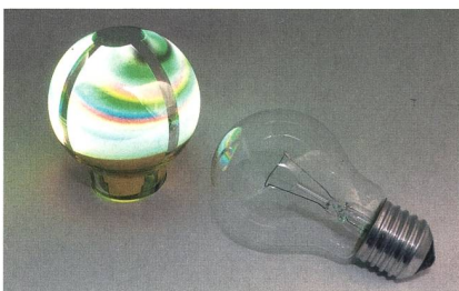
Glühbirnenersatz: organische LED

Die OLED-Birne wird eine vollwertige Alternative zur klassischen Glühbirne werden. Sie gibt die Farben innerhalb eines Raumes deutlich besser wieder als beispielsweise eine Halogen- oder Kompaktleuchtstofflampe. No