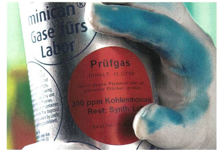
Der Sensorhandschuh färbt sich in Gegenwart eines Gefahrstoffs blau.