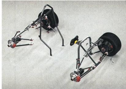
Das Fahrwerk des «Julier».

Die – vor allem wegen ihrer hohen Energiedichte – in vielen Elektronikgeräten als Energiespeicher eingesetzten Lithiumionen-Batterien haben den Ruf, keinen Memory-Effekt aufzuweisen. Forscher des Paul Scherrer Instituts PSI und des Toyota-Forschungslabors in Japan haben nun bei einem weit verbreiteten Typ der Lithiumionen-Batterie doch einen Memory-Effekt entdeckt. Besonders relevant ist der Fund für die Elektromobilität. No