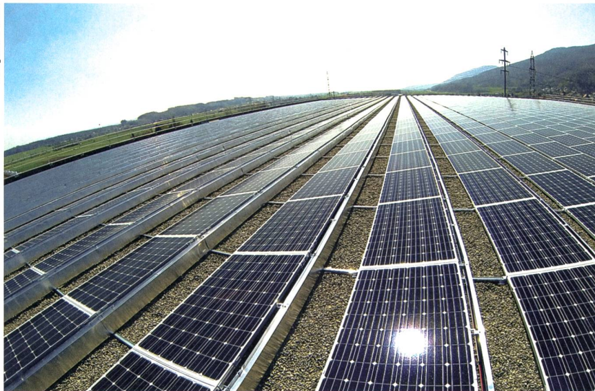
Das grösste Schweizer Solarkraftwerk in Neuendorf, Kanton Solothurn, mit einer Spitzenleistung von 5,2 MW.