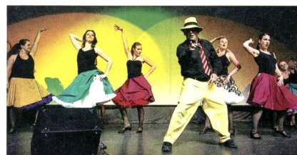
Die Seventy Seven Dancers legen eine feurige Darbietung hin.