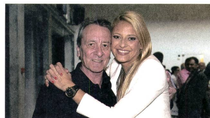
Unternehmenstreue zahlt sich aus: Dieser Jubilar genießt den Moment mit Christa Rigozzi.