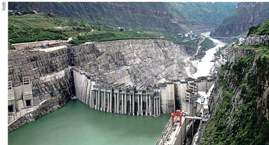
Wenn das Kraftwerk Xiluodu im Juni 2014 komplett ans Netz geht, wird es mit seinen insgesamt 18 Maschineneinheiten eine Nennleistung von 13,86 GW haben.

China hat derzeit Wasserkraftwerke mit einer Kapazität von 250 GW installiert. No