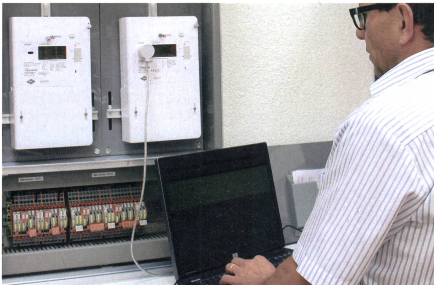
Intelligente Zähler sollen einen Beitrag zur Energiewende leisten.