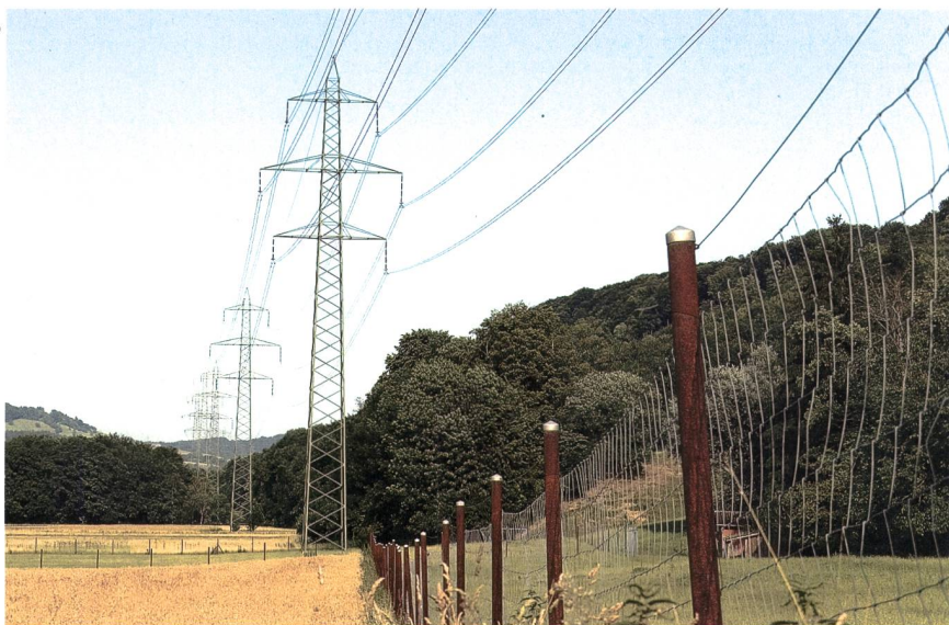
Die gestiegenen Kosten für das Netz sind einer der Faktoren, die zu einem durchschnittlich leicht höheren Strompreis 2014 führen.