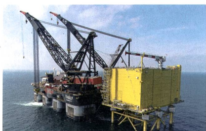
320-kV-Umrichterstation mit 800 MW Leistung.

Den Auftrag für die Konstruktion, Planung, Lieferung und Installation der Offshore-Netzanbindung erhielt ABB von Tennet, einem niederländischen Übertragungsnetzbetreiber. No