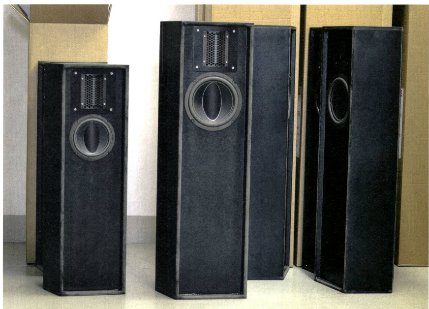
Bild 1 Bipol-Standlautsprecher von Rowen ohne Stoffbespannung. Oben sieht man den für den Hoch- und Mitteltonbereich zuständigen Linear Motion Transformer, darunter den Basstreiber.