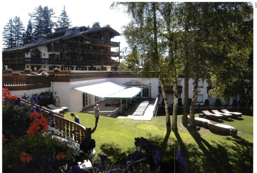
Le Grand Hôtel du Golf est un lieu propice pour se mettre au vert.

S'il faut reconnaître que l'infrastructure technique n'était pas à la hauteur de l'événement, les participants ont eu l'indulgence de se focaliser davantage sur le programme cadre. Pour ce qui est des conférences, comme chaque année, l'événement se veut généraliste et varié, il y a donc des conférences qui répondent plus aux attentes de certains qu'à d'autres et dans l'ensemble, c'est aussi cette variété qui caractérise nos journées. Cr