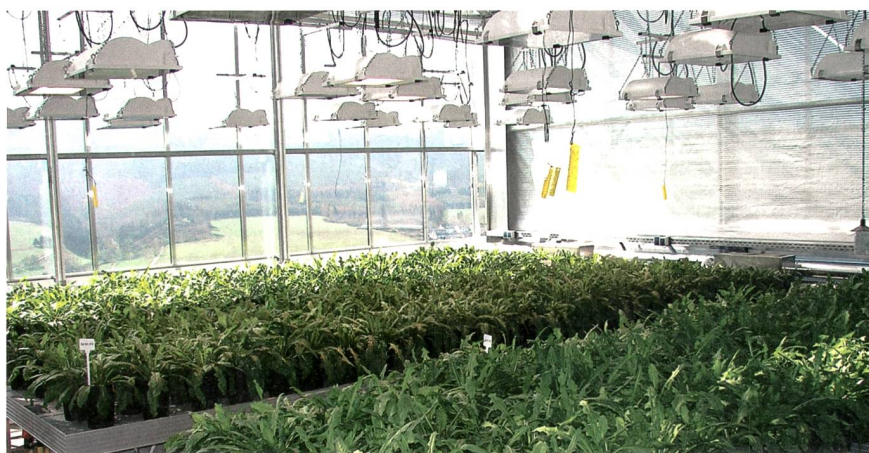
Installation pilote de Münster destinée à la culture de pissenlit à teneur particulièrement élevée en caoutchouc.

L'aigrette de pissenlit possède trois avantages sur l'arbre à caoutchouc. En effet, sa période de végétation dure seulement un an et non plusieurs années. Les plantes peuvent être ensuite récoltées immédiatement afin de poursuivre leur optimisation. De plus, l'aigrette de pissenlit est moins sensible aux parasites. Enfin, elle ne nécessite pas de climat subtropical et peut donc être cultivée dans les champs européens. No