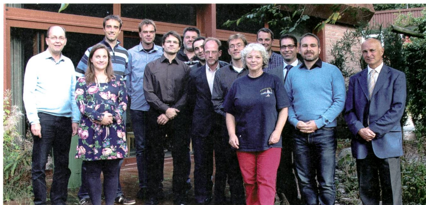
Bauen eine Datenbank, die Meeressäuger vor Unterwasserlärm schützen soll: das Team des Projekts «Protection of Marine Mammals».