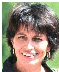
La conseillère fédérale Doris Leuthard , Cheffe du Département fédéral de l'environnement, des transports, de l'énergie et de la communication

La transition énergétique est en marche! Au niveau politique, social et économique, la nouvelle politique énergétique rencontre d'ores et déjà une large acceptation. Et ils sont déjà nombreux à avoir pris le train en marche. Depuis mai 2011, nous enregistrons un net développement des installations de production d'électricité à partir d'énergies renouvelables. Les consommateurs sont toujours plus nombreux à vouloir connaître l'origine de l'électricité qu'ils consomment. L'utilisation plus consciente et plus économe de l'énergie fait désormais partie intégrante des critères d'achat d'un appareil ou d'une voiture efficace sur le plan énergétique, de location d'un appartement, d'assainissement énergétique d'un bâtiment et d'optimisation des processus industriels. De nombreux cantons,