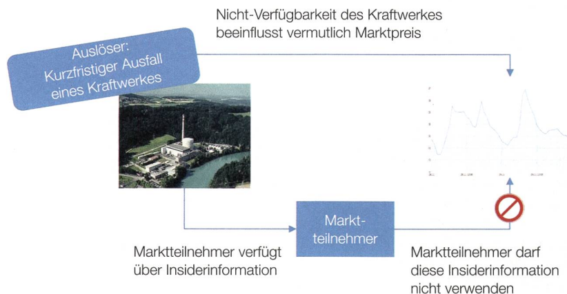
Bild 2 Prinzip des Insiderhandels.

Eine nicht zu unterschätzende Herausforderung stellt für die Marktteilnehmer künftig auch die Pflicht zum Re-