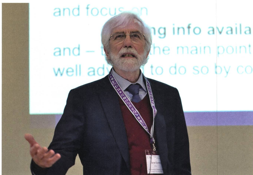
Der emeritierte ETH-Professor Daniel Spreng erläuterte die Beziehungen von Information, Energie und Wachstum und plädierte aus energetischen Gründen für qualitatives statt quantitatives Wachstum.

Eine relevante Frage stellte sich ein österreichisches Team: Kann man mit intelligenten Stromzählern Energie sparen? Die Untersuchung zeigte, dass der eigentliche Smart Meter den Hauptanteil des Energieverbrauchs des gesamten Erfassungssystems stellt, wobei Power Line Communication deutlich energieinten-