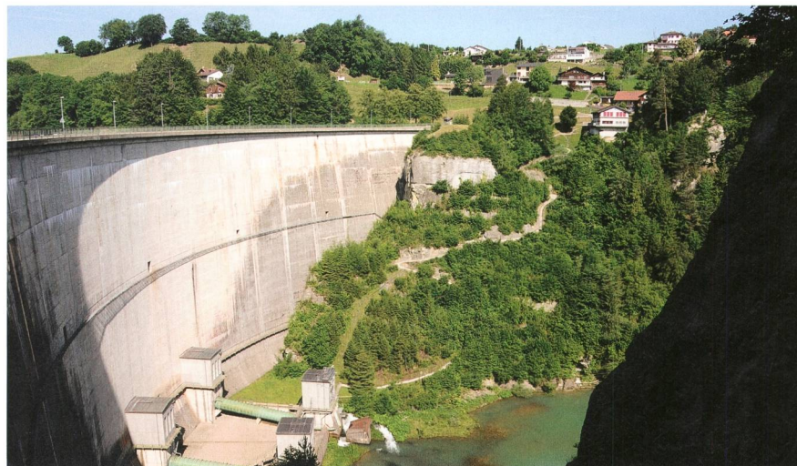
Die Stauanlage Rossens am Lac de Gruyere wurde von den Gutachtern als erdbebensicher beurteilt.

dingungen. Ursprünglich hätten die Konzepte bis Ende 2013 eingereicht werden sollen. Die Studie zur Beurteilung der Gefährdung beansprucht jedoch mehr Zeit als ursprünglich vorgesehen. Aus diesem Grund haben die Betreiber der Kernkraftwerke eine Fristverlängerung beantragt, die vom Ensi gewährt wurde, da keine akute Gefährdung besteht. Bis Mitte 2014 müssen die Betreiber nun den Nachweis erbringen, dass ihre Anlagen ausreichend gegen 10 000-jährliche Wetterereignisse wie Winde und Tornados, Starkregen oder extreme Schneemassen geschützt sind. Se