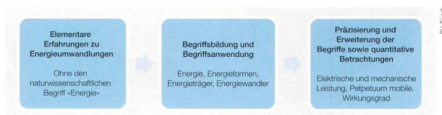
Bild 1 Aufbau der Einheiten vom Kindergarten bis zum Ende der Sekundarstufe 1.

Mit den Energieeinheiten sollen den Kindern im ersten Zyklus Energieumwandlungen durch konkrete Beispiele bewusst gemacht werden: Zum Beispiel hat eine hochgehobene und oben in eine Kugelbahn gelegte Kugel nach dem Herunterrollen eine Geschwindigkeit oder ein Basketball beim Herunterfallen von einem Turnkasten eine grössere «Wucht» als ein Softball. Nachdem im ersten Zyklus darauf verzichtet wird, den naturwissenschaftlichen Begriff der Energie einzuführen, geht es im zweiten Zyklus genau darum: Die Energie wird als etwas «Antreibendes» eingeführt. Es werden Energieformen wie z.B. Lageenergie oder Bewegungsenergie, Energieträger wie z.B. Wind oder Wasser sowie Energiewandler wie z.B. ein Elektromotor oder ein Dynamo eingeführt. Im dritten Zyklus geht es dann schliesslich darum, diese Begriffe zu schärfen und quantitativ zu betrachten. Vor allem im Bereich der mechanischen und elektrischen Energie geht es auch darum, Berechnungen anzu-