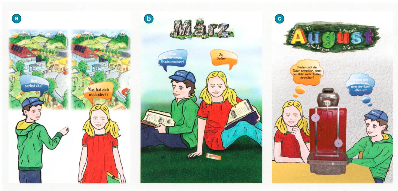
Bild 2 Startseite sowie zwei exemplarische Monate des Energiekalenders.

stellen. Insgesamt lag ein besonderes Augenmerk jeweils auf innovativen, interessanten Experimenten, welche das jeweils gewünschte Phänomen eindeutig und eindrücklich zeigen.