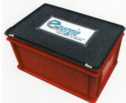
Bild 3 Materialbox.