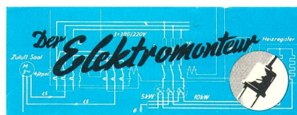
«Der Elektromonteur» erscheint alle 2 Monate – Abonnementpreis Fr. 4.– pro Jahr – Inseratvermittlung, Druck und Expedition: Buchdruckerei Hiltner Angewandte Zeitung, Aarau – Red.: Hans Schwab, Augstin-Keller-Strasse 10, Aarau

Der Zeitpunkt für die Gründung einer elektrotechnischen Fachzeitschrift war gekommen. Die redaktionelle Aufgabe bestand darin, den damaligen Elektromonteuren mit und ohne Höhere Fach-