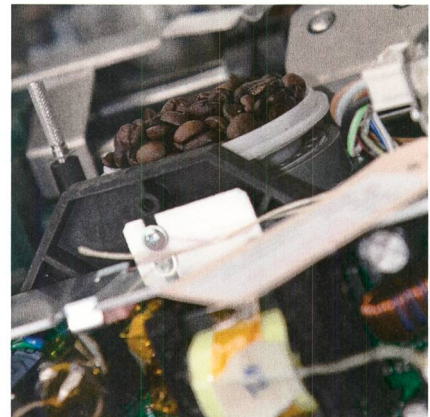
Le domaine d'activité Industrie et Commerce a pour objectif d'assurer la sécurité des produits.

Electrosuisse, 8320 Fehraltorf, fritz.beglinger@electrosuisse.ch