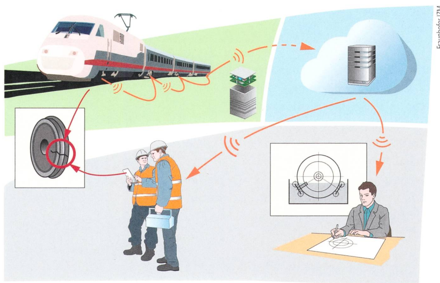
Cloud-gestütztes Sensornetzwerk zur zustandsbasierten Instandhaltung von Schienenfahrzeugen.

dermayer können die Sensorknoten kleinste Schwingungsänderungen erfassen. Das ermöglicht eine Reparatur, bevor es scheppert und sich ein Schaden ausbreitet. No