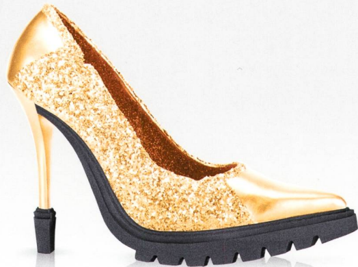
SE:Supply&Trade – sicher auf grossem Parkett Die Edition für Beschaffung und Handel