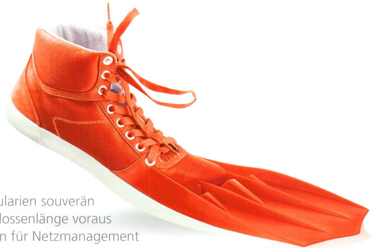
SE:Grid – den Regularien souverän eine Flossenlänge voraus Die Edition für Netzmanagement