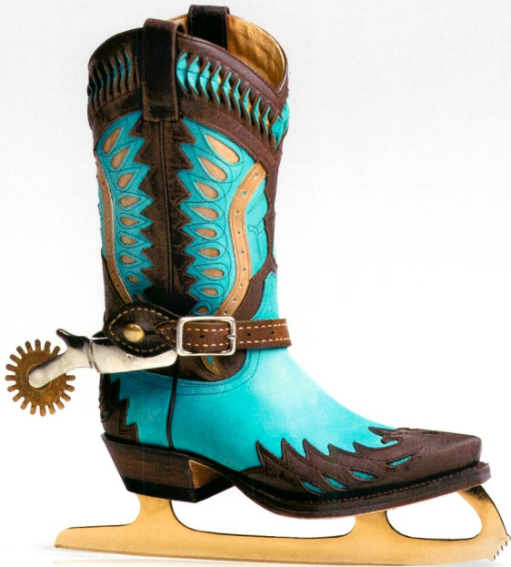
SE:Metering – smart die Kuh vom Eis bekommen Die Edition für Meter Data Management