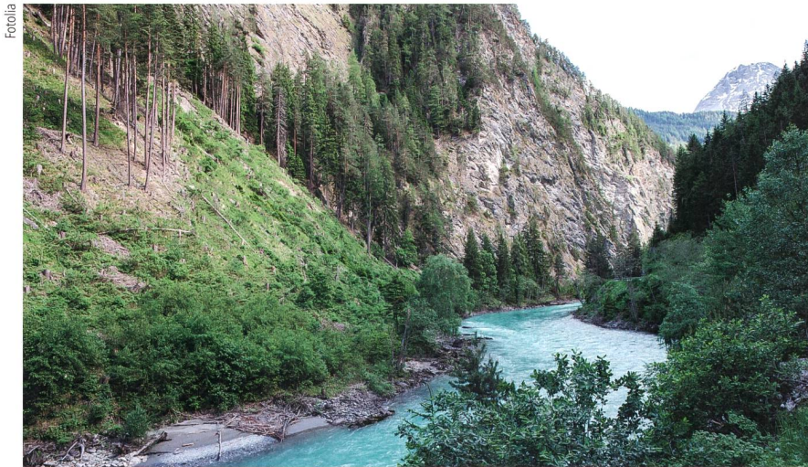
Bild 2 Aufgrund von Hindernissen wie Bergen, Wäldern und Felsen ist die Modellierung von Windverhältnissen in der Schweiz viel anspruchsvoller.