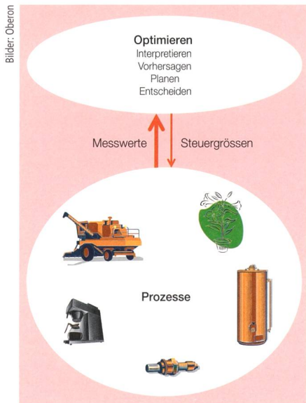
Bild 3 Prozessoptimierung mittels Instrumentierung der Welt.

den, z.B. um Fahrzeiten und Treibstoffverbrauch zu minimieren.