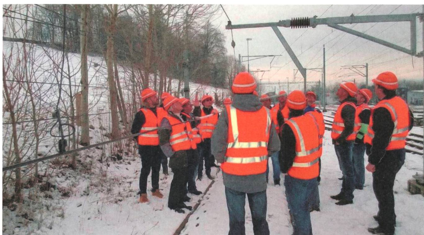
Die reformierte Berufsausbildung ist auch für die Berufsbildner eine Herausforderung. Im Bild: Impression aus dem Weiterbildungskurs «Berufsbildner/in Netzelektriker/in».

Der Lehrgang «Berufsbildner/in Netzelektriker/in EFZ» (Trägerschaft VSE, VöV und VFFK) bietet Berufsbildnerinnen und Berufsbildnern eine Hilfestellung, um sich schnell einen Überblick über die Anforderungen der neuen Berufsausbildung zu verschaffen. Die nächsten Durchführungen starten am 17. Juni 2015 sowie am 27. Oktober 2015. Weitere Informationen: www.strom.ch/veranstaltungen .