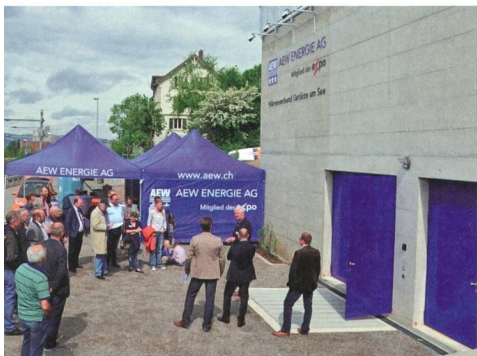
Einweihung des AEW-Wärmeverbunds in Uetikon am See am 9. Mai 2015.