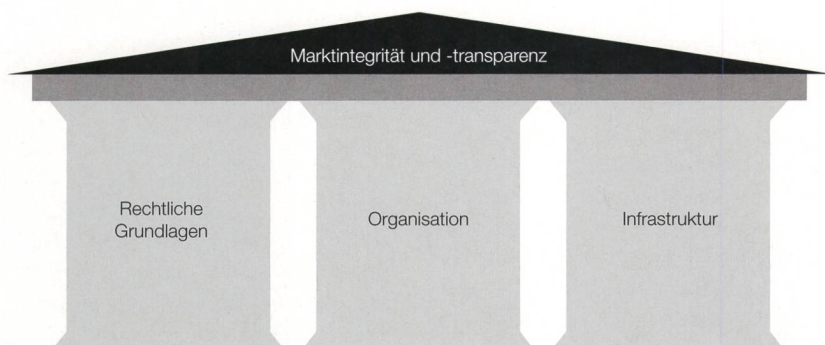
Bild 1 Drei Säulen zur Schaffung von mehr Marktintegrität und -transparenz.

Die ElCom und die Schweizer Behörden sind sich der Herausforderung bewusst, dass die Schweiz als Nicht-EU-Mitglied über andere rechtliche Rahmenbedingungen im Elektrizitätsbereich verfügt. Der Bundesrat fügte da-