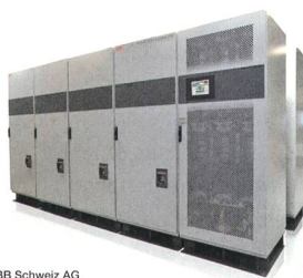
ABB Schweiz AG Power Protection / Newave Brown Boveri Platz 3, CH-5400 Baden Am Wald 36, CH-2504 Biel/Bienne Tel: +41 58 586 01 01 ups@ch.abb.com

Wenn ABB PCS100 USV-Lösungen eingesetzt werden. PCS100 ist eine einzigartige Produktfamilie, basierend auf wegweisenden Technologien. Hohe Verfügbarkeit mit geringstem Energieaufwand bedeutet mehr Produktivität. Egal ob für Nieder- oder Mittelspannung. Beide Systeme führen zu einem Mehrwert in der Industrie, bei der öffentlichen Elektrizitätsversorgung und bei kommerziellen Anwendungen. Erfahren Sie mehr unter: www.abb.ch/ups