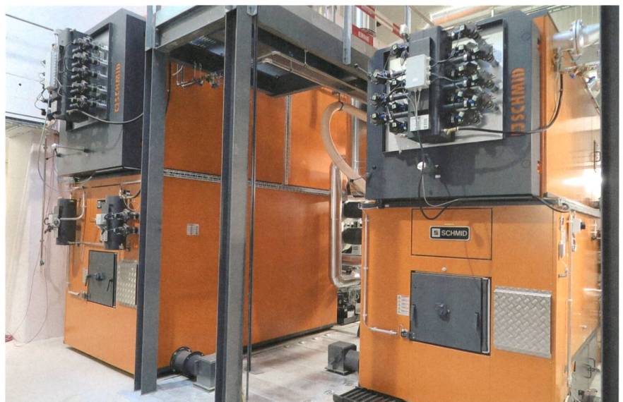
Zwei Holzkessel mit 750 kW sowie 1500 kW Kesselleistung.

Das unterirdisch ausgeführte Schnitzelsilo fasst 470 m 3 Holzschnitzel mit einem Energieäquivalent von 38 000 l