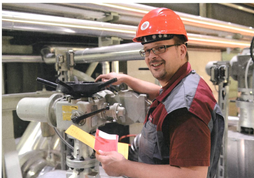
Bild 1 Hohe Verantwortung: ein KKW-Anlagenoperateur beim Absichern einer Armatur im Kernkraftwerk Gösgen.

Die KKW-Anlagenoperateure betreuen vorab alle Anlagen und Systeme, die ausserhalb der Warte (Kommandoraum) liegen. Sie kontrollieren auf Rundgängen durch Reaktor- und Nebengebäude, Maschinenhaus und Aussenanlage sämtliche Wasseraufbereitungs-, Lüftungs- und Aussenanlagen sowie die Anlagenteile, die nur vor Ort bedient werden können. Sie lesen die Messwerte für Prozessgrössen wie Temperatur, Druck, Spannung oder Leistung ab, tragen sie in Tabellen ein und vergleichen sie mit den vorgegebenen Sollwerten. Unregelmässigkeiten, Leckagen oder Defekte melden sie sofort dem Kommandoraum. Von dort nehmen sie Anweisungen des Reaktoroperateurs oder des Schichtchefs entgegen. Bei entsprechender Erfahrung leiten sie auch selbst nach exakt definierten Vorgehensregeln die nötigen Massnahmen ein. KKW-Anlagenoperateure betreuen Hilfsanlagen selbstständig und nehmen auf Anweisung oder gemäss Checklisten Schalthandlungen vor. Sie setzen beispielsweise Filtersysteme in Betrieb oder bringen Ventile in