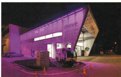
Die Demonstrations- und Technologietransferplattform «Move» der Empa.

Zwei Erkenntnisse legten die Basis: Die Mobilität ist in der Schweiz für rund 40% des CO 2 -Ausstosses verantwortlich. Diese Emissionen lassen sich am deutlichsten durch ein Umsteigen auf erneuerbare Energien senken. Gleichzeitig zeigt sich, dass im Sommer ein Überschuss an Solarstrom besteht, der sich im Strommarkt nur schwer nutzen lässt. Eine Umwandlung in synthetische Treibstoffe für die Mobilität macht genau dies möglich. No