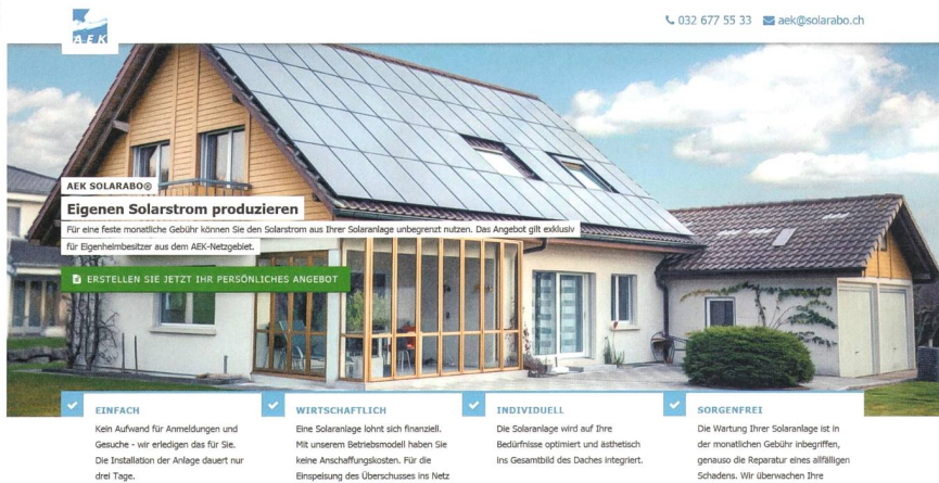
Bild 2 Als einer der ersten Energieversorger setzt AEK das Konzept des Solarleasings in der Schweiz um. Gegen eine monatliche Gebühr können die Kunden eine Solarstromanlage auf dem eigenen Dach nutzen. Der Screenshot zeigt die Website der Vertriebs-Plattform, auf der Interessenten mit einem Mausklick eine massgeschneiderte Offerte anfordern können.

Wie bereits erwähnt, haben denn auch diverse EVUs eine Solarabteilung aufgebaut oder dazugekauft. Und einige EVUs halten Solarkonzepte in der Schublade, um reagieren zu können, falls sich der Markt mit dem Eigenverbrauch schneller als erwartet entwickelt. Doch warum steigen EVUs ins Solargeschäft ein und konkurrenzieren sich gewissermassen selber? Dafür spricht, dass die Verbreitung von Solaranlagen zur Eigenversorgung kaum mehr aufgehalten werden kann. Mit anderen Worten: Angesichts des drohenden Absatzverlusts möchten sie wenigstens mit dem Verkauf der Solaranlage einmalig daran verdienen.