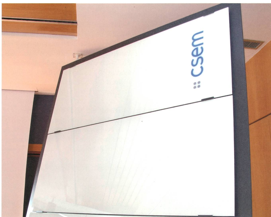
Figure 1 Prototypes de modules photovoltaïques blancs réalisés au CSEM.

Il faut cependant savoir que le blanc est la couleur qui reflète (traduisez: rejette) la majorité de la lumière, une propriété totalement contraire à ce que l'on souhaite d'un panneau solaire standard. Malgré la forte demande des milieux de la construction, personne n'avait été en