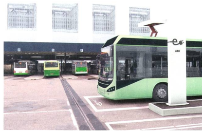
Schnellladelösung mit Remote-Diagnose.