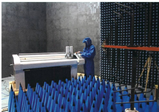
Bild 1 Es kommt oft vor, dass ein Gerät bei der EMV-Prüfung (bis 20 V/m) bedient oder direkt überwacht werden muss.

Funktionen eines Prüflings, die für sicherheitsbezogene Anwendungen benutzt werden, dürfen nicht ausserhalb ihrer Spezifikation beeinflusst werden oder können vorübergehend oder dauerhaft gestört werden, falls der Prüfling auf eine Störung so reagiert, dass ein feststellbarer definierter Zustand (DS) eingestellt oder in einer bestimmten Zeit erreicht wird. Das Bewertungskriterium DS (Defined State) wurde früher als FS (Fail Safe) bezeichnet. Auch eine Zerstörung ist erlaubt, falls ein feststellbarer, definierter Zustand (oder Zustände) eingestellt oder in einer bestimmten Zeit erreicht wird.