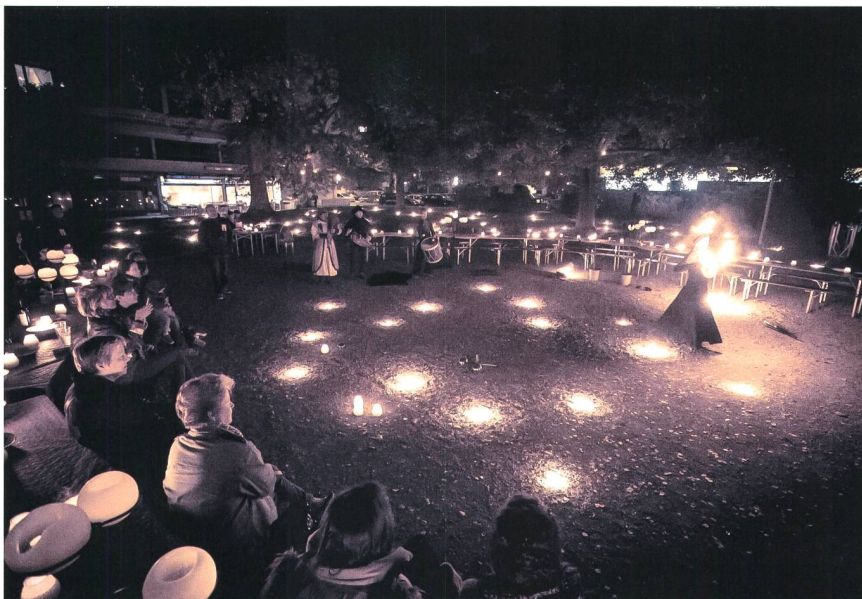
Figure 2 Se déconnecter et passer une soirée ensemble.

avec leurs enfants à ce sujet. La recherche montre aussi que le contexte spatial a une influence importante sur ce qui est jugé normal et souhaitable en matière d'accès à Internet et d'usages d'équipements connectés. Ainsi, dans la plupart des ménages rencontrés, l'usage des smartphones est prohibé pendant les repas familiaux à la maison. En revanche, à l'extérieur, notamment au cours des repas au restaurant, les parents ne rechignent pas à laisser leurs enfants utiliser les iPads ou iPhones et « acheter » ainsi leur tranquillité.