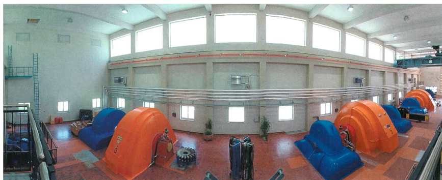
Ein Blick in das Maschinenhaus zeigt die drei revidierten Generatoren, die zuverlässig von einer neuen Löschanlage geschützt werden.

Die Gesamterneuerung des Kraftwerks Tinizong konnte im Sommer 2015 erfolgreich abgeschlossen werden. Nebst den Revisionsarbeiten für die elektromechanischen Anlagenteile wurden die Sicherheitsanlagen für deren Schutz ebenfalls modernisiert.