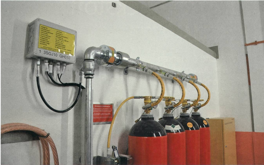
Die Hochdruckstahlflaschen lagern den Stickstoff bei 300 bar.